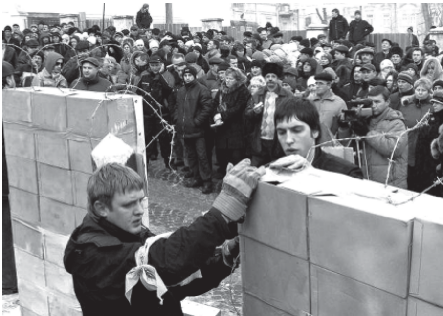
der "Mauerbau" vor dem polnischen Konsulat in Lwiv

Visum. Trotzdem sind auch 35 Euro eine deutliche Verschlechterung der Lage. Bislang hatten nämlich Lettland, Polen, Litauen, die Slowakei und Ungarn ihren Nachbarn gegenüber eine liberale Visapolitik vertreten. So wurden Visaanträge gebührenfrei oder gegen eine geringe Gebühr bearbeitet, waren die Verfahren einfacher (die Liste erforderlicher Dokumente war weniger umfangreich) und die Wartezeiten kürzer (oftmals wurde das ganze Verfahren in nur einem Tag abge-